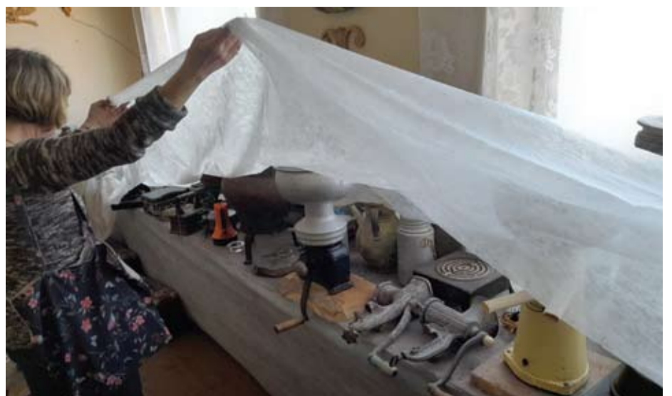
Eksponatus nuo aplinkos poveikio bandoma apsaugoti pridengus juos plėvele.