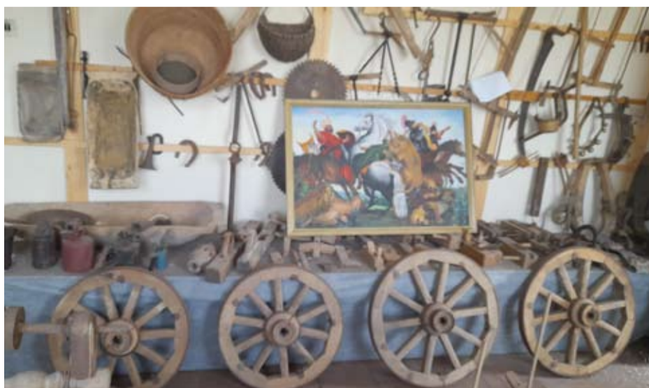
Daug visko buvo sugabenta į tuo metu eksploatuojamo administracinio pastato trečiąjį aukštą.