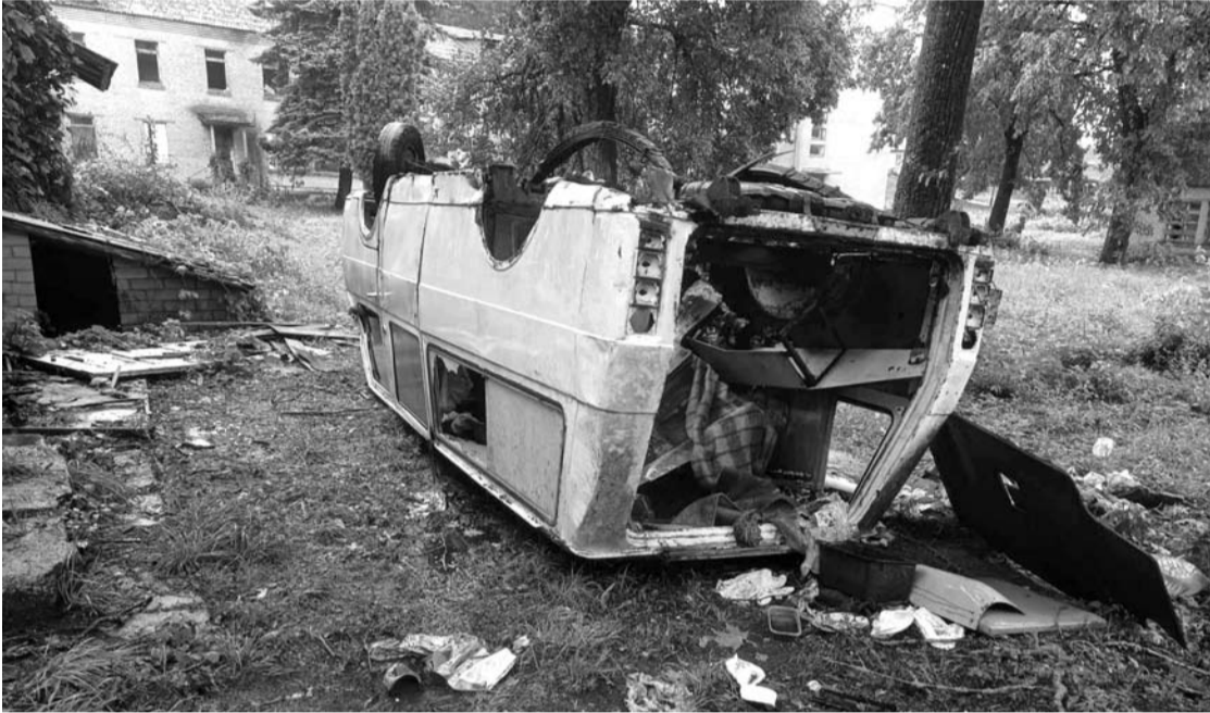
Šiame automobilyje vienas benamis buvo įsirengęs guolį.