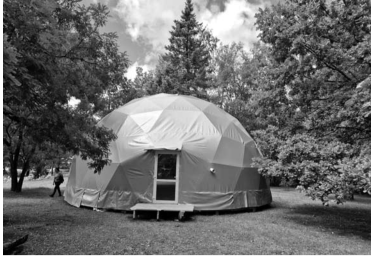
Šiame kupole rajono moksleiviai mokysis valdyti robotus.