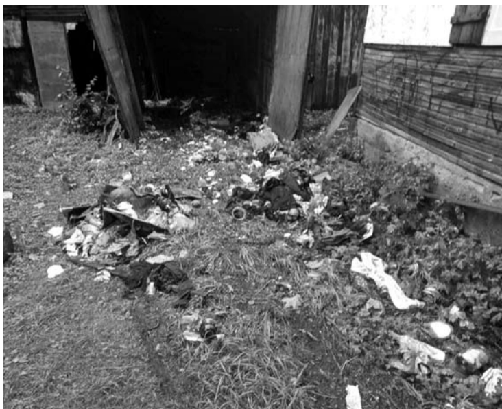
Pamatęs prišiukšlintą senosios ligoninės teritoriją, skaitytojas nuogastavo, kad miesto centras virsta šiukšlynu.

Jis taip pat atsiuntė trumpą vaizdo siužetą, kuriame užfiksuoti buvusios senosios ligoninės viename iš pastatų laiką leidžiantys benamiai. Šį vaizdo siužetą galima pamatyti portale anyksta.lt.